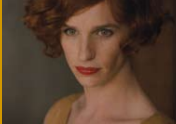
THE DANISH GIRL (USA/GB 2015)