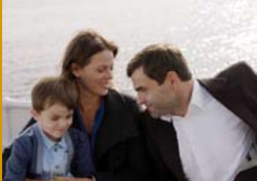
DIE HÄNDE MEINER MUTTER (DE 2016)

türlichkeit und begeisterte damit beispielsweise in der Titelrolle von Helmut Käutners FRAU NACH MASS (1940) die Zuschauer. Als die Witwe Maria plötzlich von einem Lebenszeichen ihres Mannes in Rio hört, reist sie sofort nach Brasilien. Dort angekommen, findet sie aber nur noch seinen Leichnam, steht plötzlich selbst unter Tatverdacht und wird in ein mysteriöses Abenteuer hineingezogen.