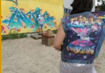
GIRL POWER (CZ 2016)