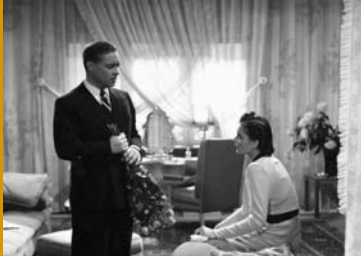
ZWISCHEN DEN ELTERN (DE 1938)