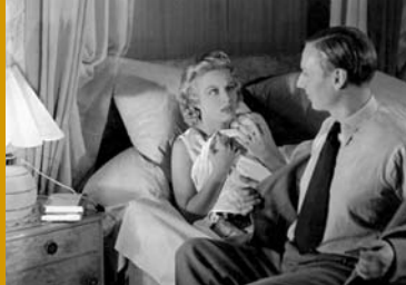
MEIN MANN DARF ES NICHT WISSEN (DE 1939)