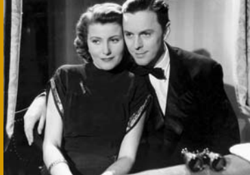
LIEBESHEIRAT (DE 1945)