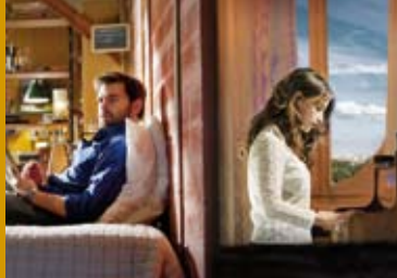
MIT DEM HERZ DURCH DIE WAND (FR 2015)