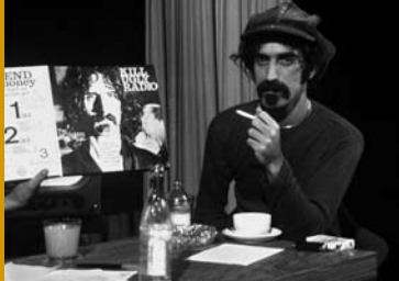
FRANK ZAPPA – EAT THAT QUESTION (FR/DE 2016)