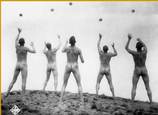
WEGE ZU KRAFT UND SCHÖNHEIT (DE 1925)

Murnastraße 6 | 65189 Wiesbaden | gegenüber Kulturzentrum Schlachthof