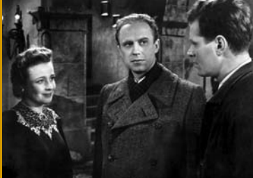
WILDVOGEL (DE 1943)