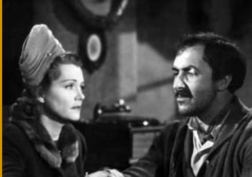
REISE IN DIE VERGANGENHEIT (DE 1943)