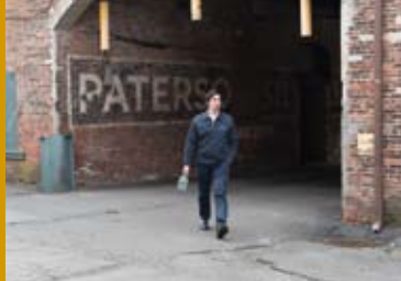
PATERSON (FR/DE/USA 2016)

füllende Stumm- und Tonfilme, sondern auch unterhaltsame, skurrile und historisch interessante Kurz-, Werbe- und Dokumentarfilme.