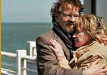
HINTER DEN WOLKEN (BE 2016)