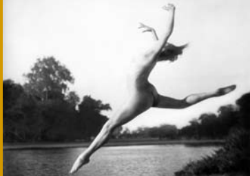
WEGE ZU KRAFT UND SCHÖNHEIT (DE 1925)