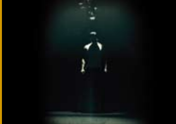
REBORN LOST (DE 2016)