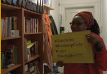
RESIDENZPFLICHT (DE 2012)