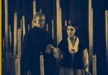
DER MÜDE TOD (DE 1921)