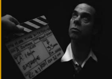
ONE MORE TIME WITH FEELING (AU 2016)